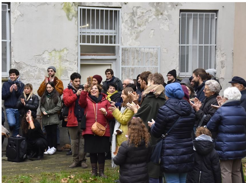
Performance conclusiva del progetto Seguimi! dell'Ass. Cult. Praxis - 15 dicembre 2019 - Quartiere San Siro