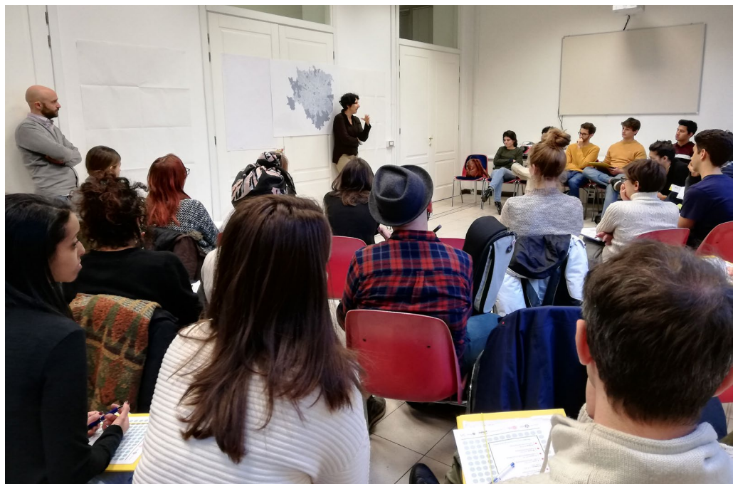
Workshop di avvio - 24 gennaio 2019 - Fabbrica del Vapore