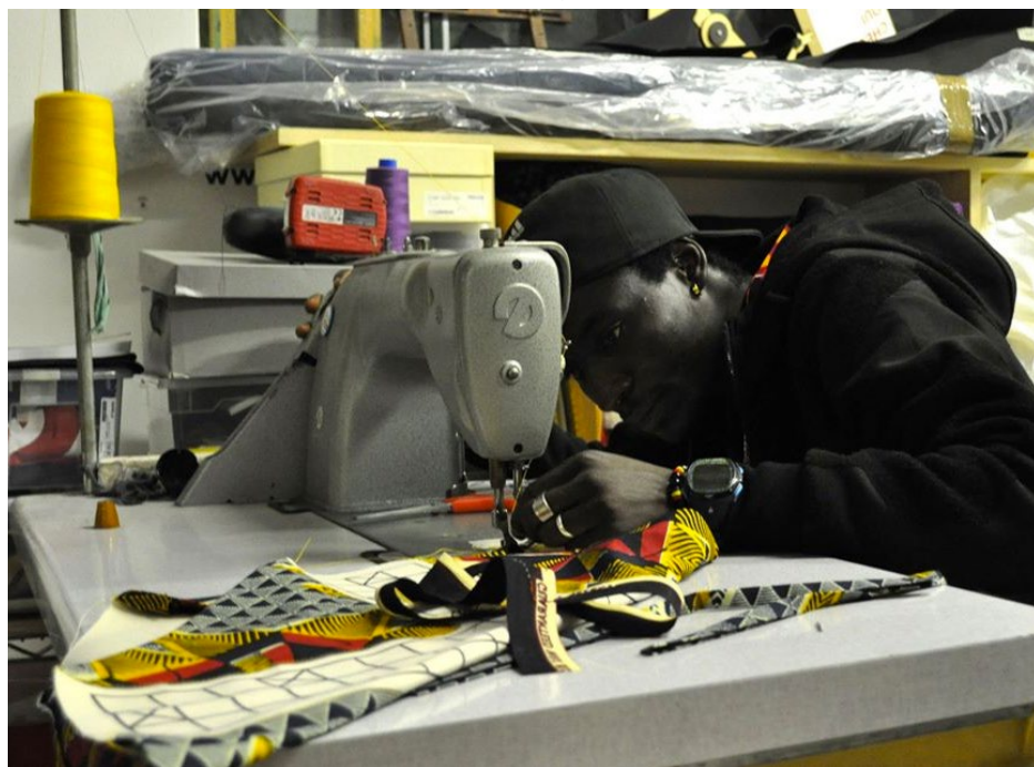
Un momento di lavoro durante il laboratorio organizzato dal progetto RAID - 23 novembre 2019 - We Make