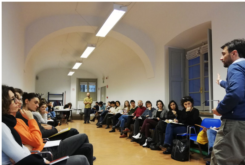
Prima comunità di pratiche con i progetti selezionati dalla Call for Ideas - 11 febbraio 2019 - Comune di Milano