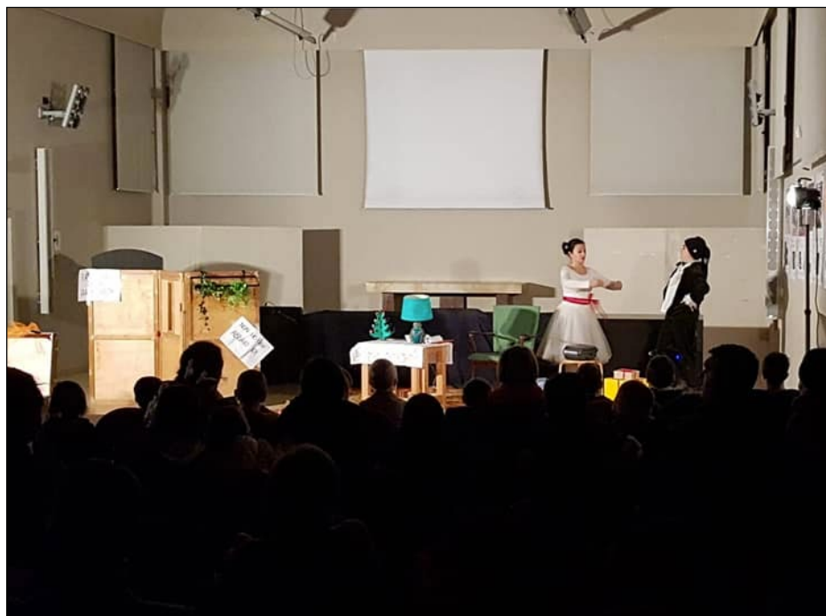
Festival La Cultura Bambina - 15 dicembre 2019 - Parco Trotter, Via Padova