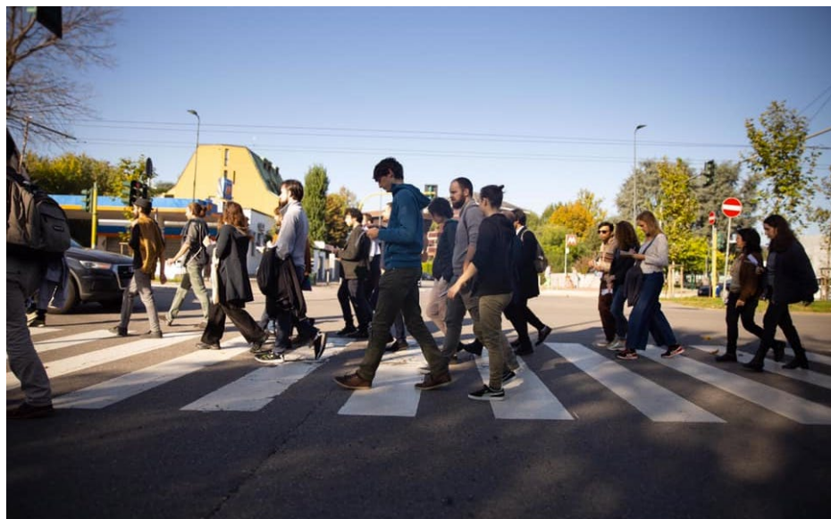
Esplorazione Urbana - Alla scoperta di Segesta - 26 ottobre 2019 - San Siro