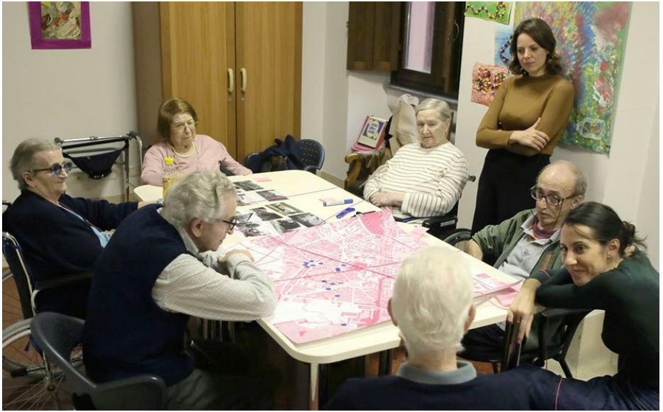
Esplorazione Urbana - Alla scoperta di Segesta - 26 ottobre 2019 - San Siro