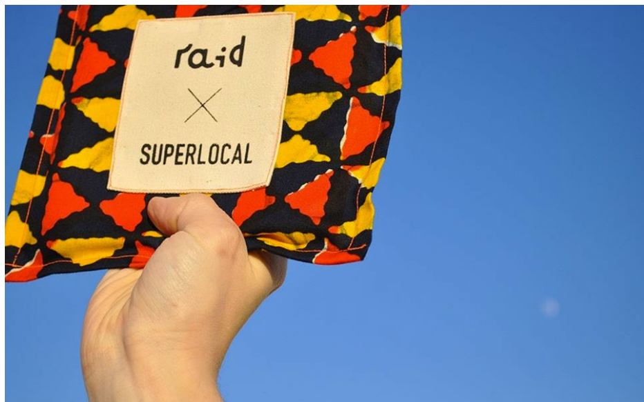
Uno dei kit da gioco prodotti dal progetto RAID