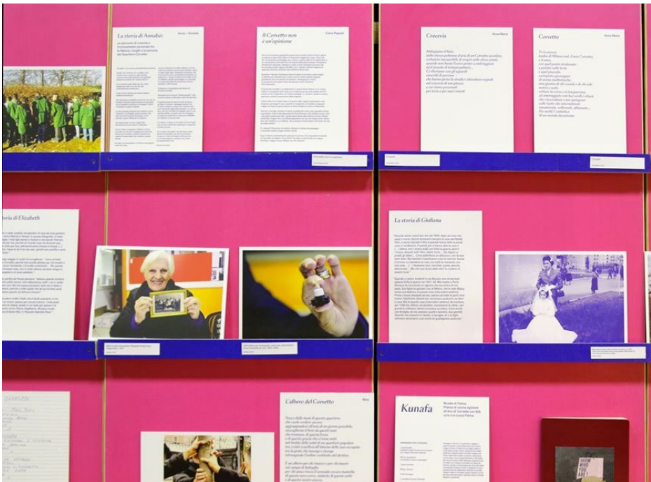
Performance conclusiva del progetto Seguiami! dell'Ass. Cult. Praxis - 15 dicembre 2019 - Quartiere San Siro