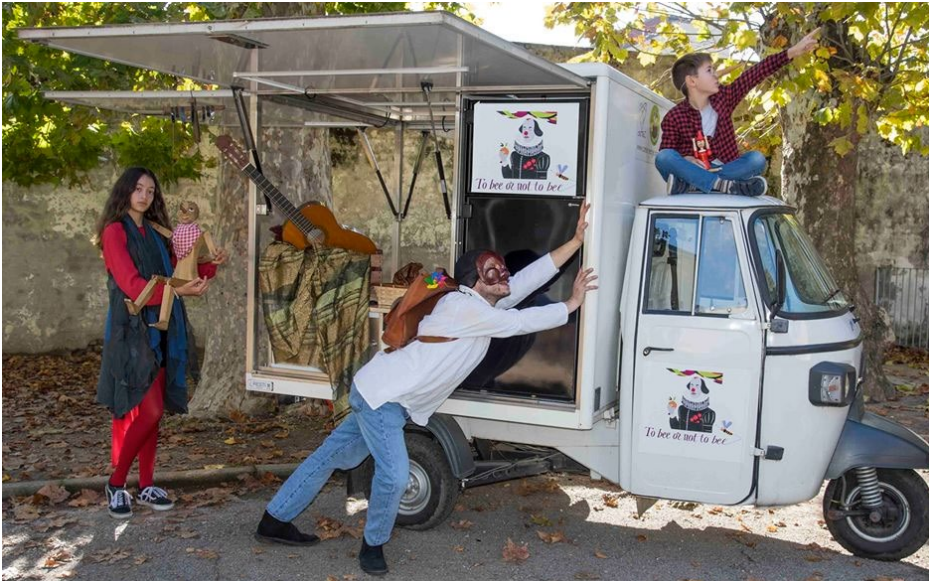
Apear del progetto Città Mondo on the Road