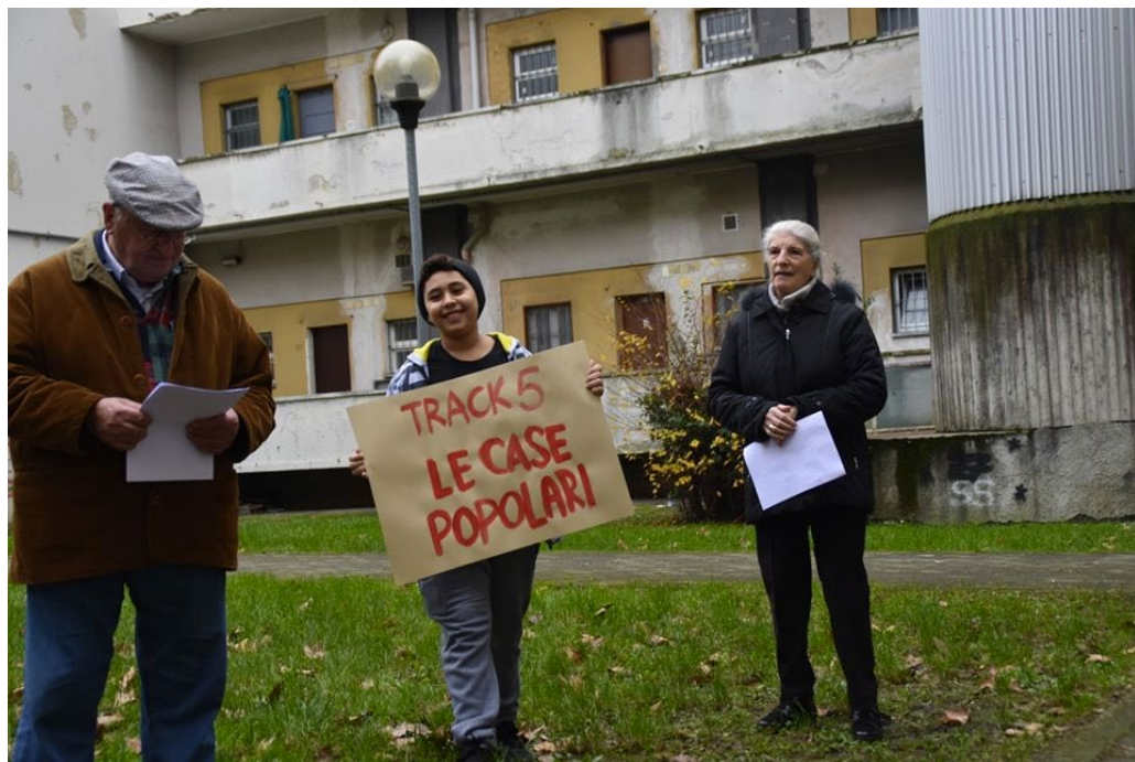
Performance conclusiva del progetto Seguiami! dell'Ass. Cult. Praxis - 15 dicembre 2019 - Quartiere San Siro