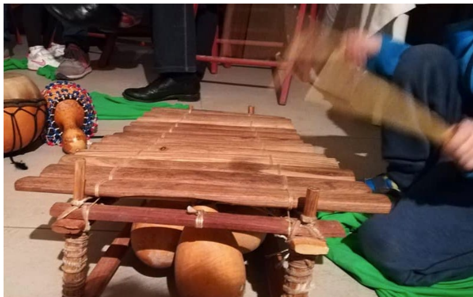
Laboratorio musicale - 6 dicembre 2019 - Parco Trotter, Via Padova