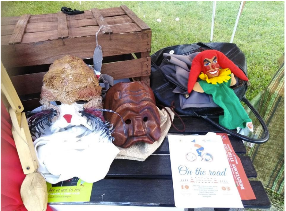
Festa delle Associazioni del Municipio 5 // 3 a edizione - 30 settembre 2019 - Gratosoglio