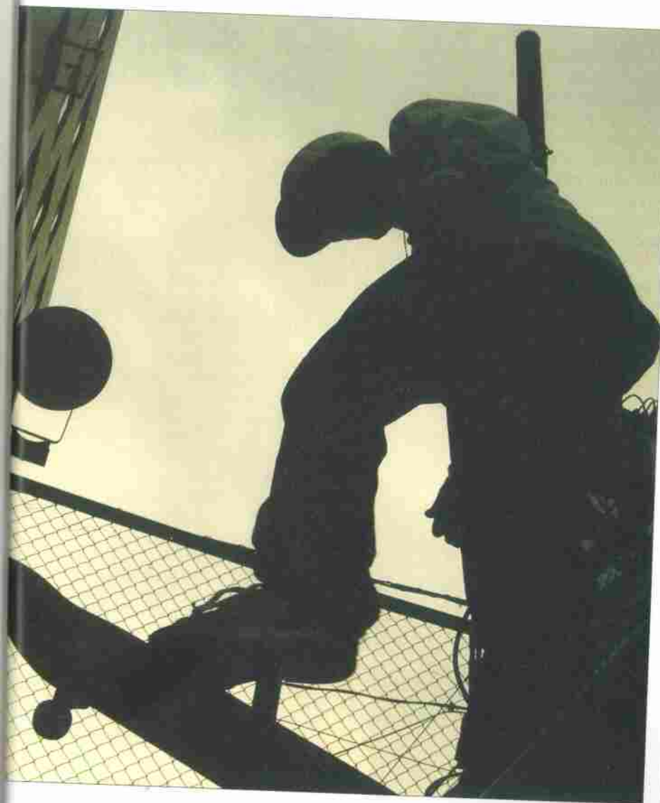
A. Rizzi/G. Neri

deserto spaesante: non c'è "comunità" che tenga per chi sente di aver subito, e non scelto, l'emigrazione. Solo chi ha condiviso la medesima esperienza, chi si sente egualmente escluso, stigmatizzato e - spesso - insofferente ad ogni appello al conformismo degli adulti appare un interlocutore possibile, qualcuno assieme al quale reinventarsi: tra la via proposta da chi ti reclama come uno dei suoi e quella di chi ti esclude perché sei diverso, aprirsi una propria.